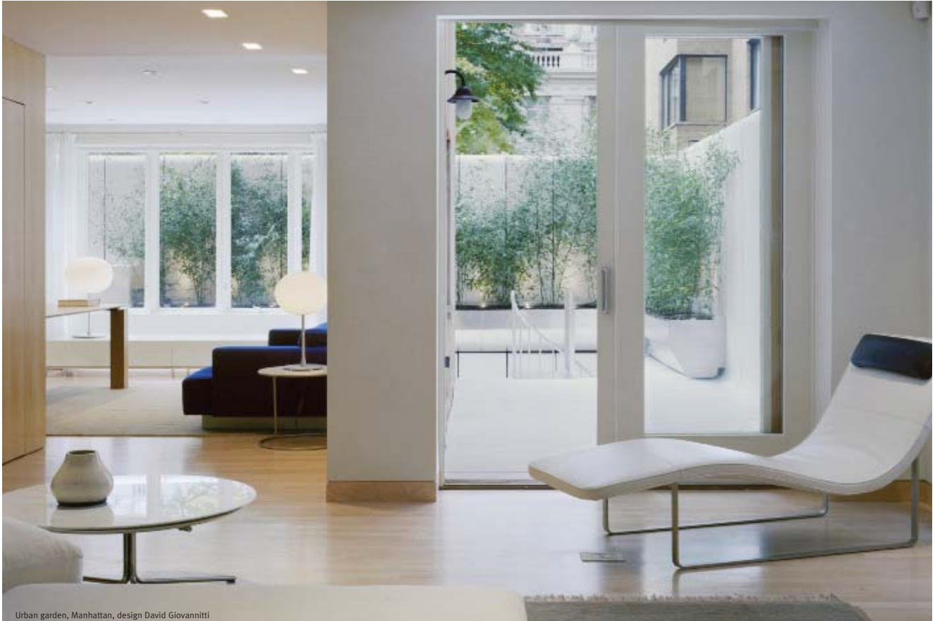
Urban garden, Manhattan, design David Giovannitti