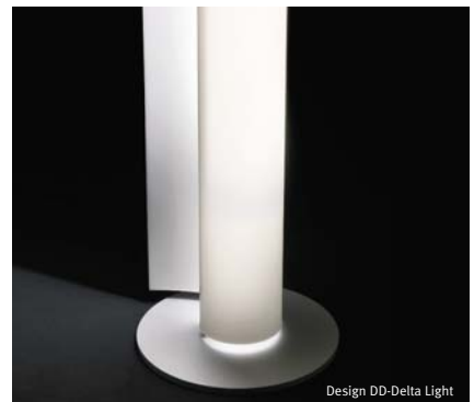
Design DD-Delta Light