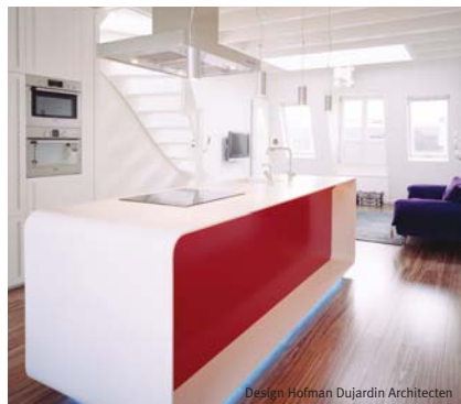
Design Hofman Dujardin Architecten