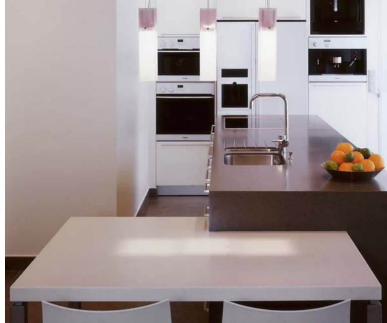
Design Sofie Lewyllie