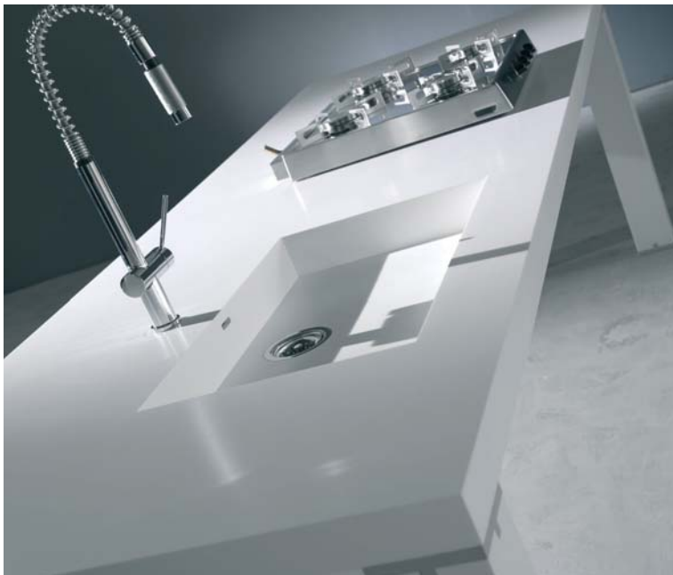
Design Lino Codato/Mathias