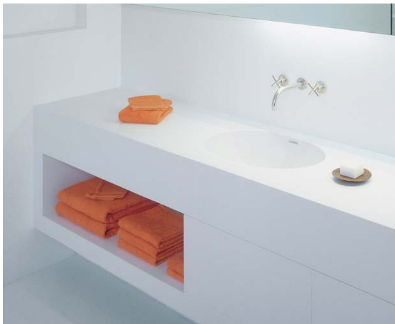
Design Sofie Lewyllie