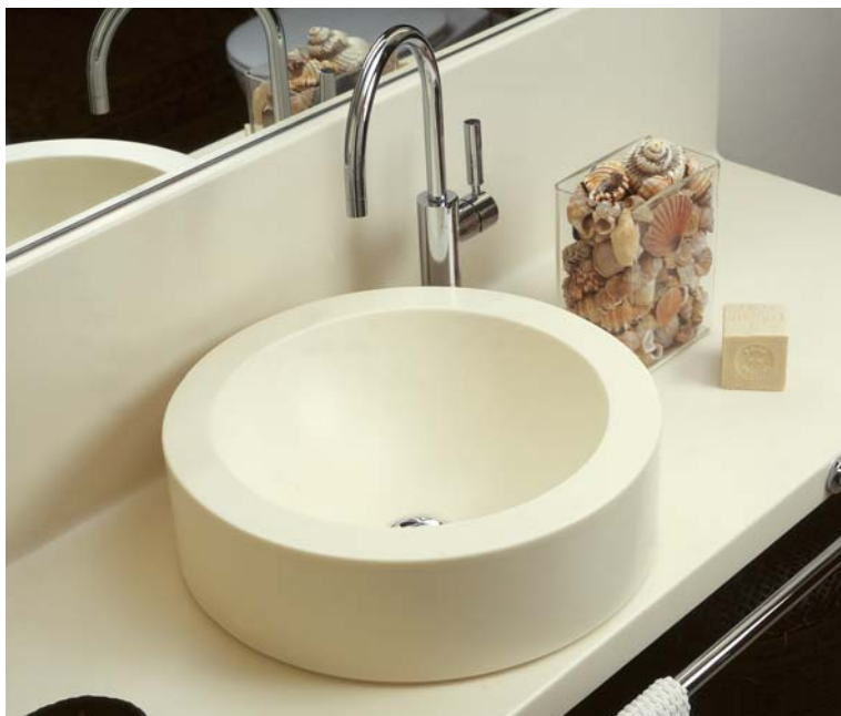
Design Massimo Fucchi