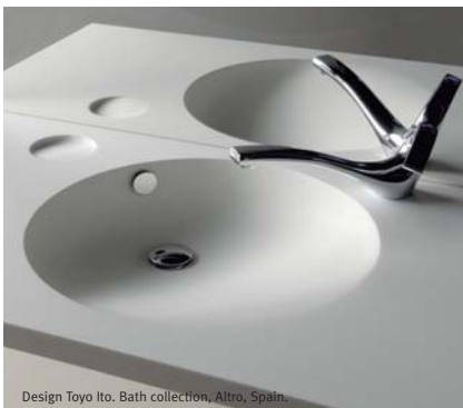
Design Toyo Ito. Bath collection, Altro, Spain.