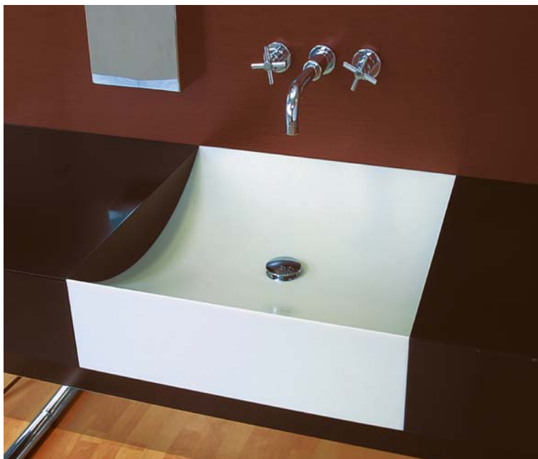
Design Massimo Fucchi