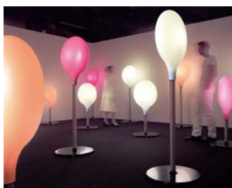
Design Marc Newson

Des évier et lavabos en Corian® sont disponibles dans une vaste gamme de tailles et de formes élégantes. Assemblez-les sans joints apparents avec les plans de cuisine et de salle de bain en Corian®.