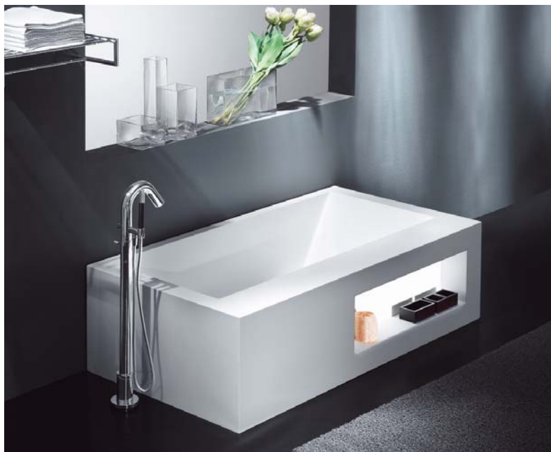
Design Giampiero Peia/Cisal