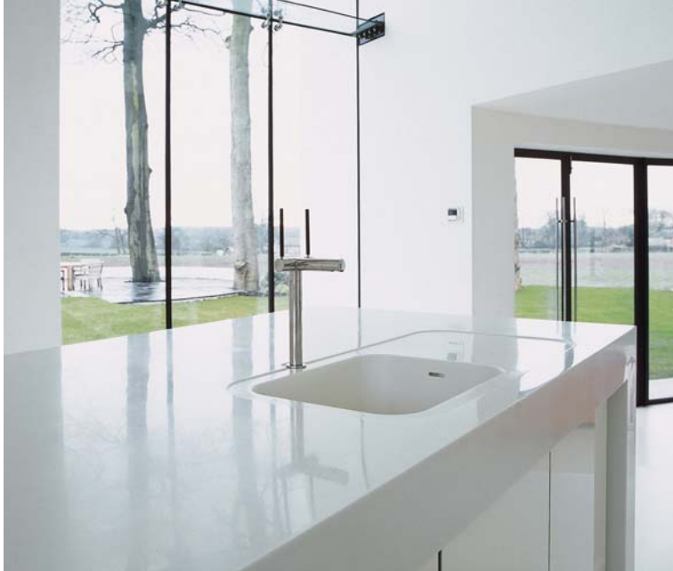
Design Ellis Williams Architects

Grâce à Corian®, la cuisine devient une affaire de goût.