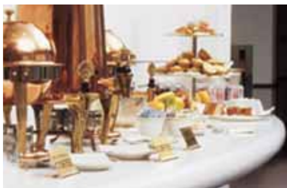
BUFFET EN CORIAN® GLACIER WHITE.

En arrière-fond, la lumière tamisée du bar invite à la détente. Dans une ambiance chaleureuse et feutrée, le comptoir en Corian® joue l'audace des couleurs à l'image des cocktails qu'y prépare le barman. Bavardages, confidences ou derniers détails d'une négociation, le monde se fait et se refait aux détours de ce comptoir ou autour des tables basses en Corian®. Et rien – ni verre renversé, ni cigarette oubliée – ne réussira à entamer sa beauté et son élégance.