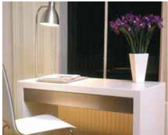
"TABLESTORE", LONDRES, ROYAUME-UNI. DESIGN ADRIAN WRIGHT. COLLECTION BRILLIANT SLAB EN CORIAN® GLACIER WHITE.