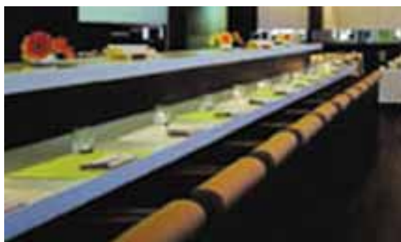
"SIDE HOTEL", HAMBOURG, ALLEMAGNE. DESIGN MATTEO THUN ET BOB WILSON. VUE D'ENSEMBLE DU BAR À SUSHI ET DE SON COMPTOIR EN CORIAN® SEAGRASS.