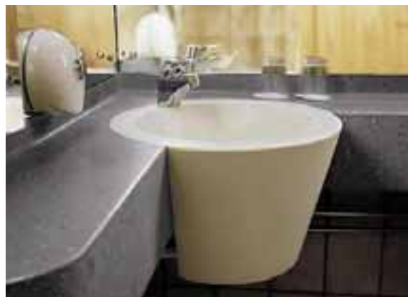
HÔTEL RADISSON SAS ROYAL VIKING, STOCKHOLM, SUÈDE. DESIGN SNICKARBOLAGET. PLAN DE TOILETTE ET LAVABO EN CORIAN® CAMEO WHITE ET CORIAN® GRAY FIELDSTONE.