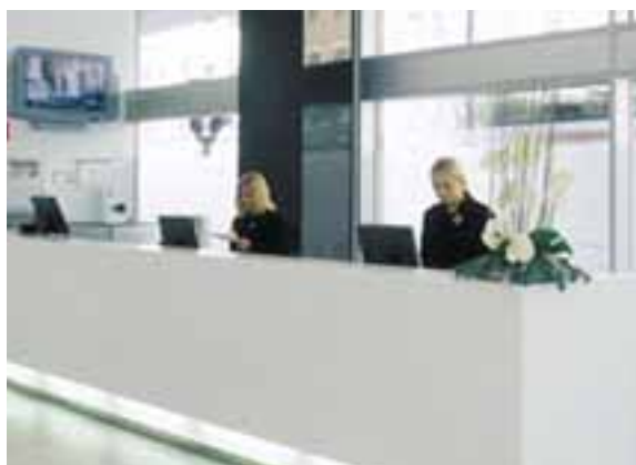
HÔTEL NORDIC LIGHT, STOCKHOLM, SUÈDE. DESIGN SJÖ FABRIKS. COMPTOIR DE RÉCEPTION EN CORIAN® CAMEO WHITE.

S'il séduit par sa propreté et sa fonctionnalité, son style et sa souplesse conceptuelle, Corian® prend aussi une dimension supplémentaire quand il est associé à d'autres matériaux pour donner une âme à un établissement hôtelier et y créer une atmosphère unique. Corian® crée un environnement subtil et personnalisé où élégance et confort sont omniprésents.