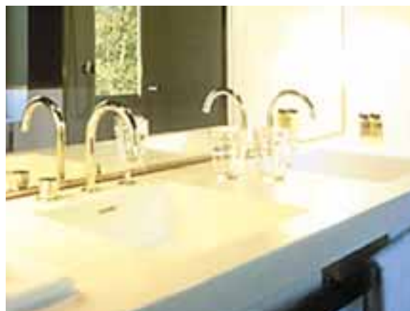
"THE HOTEL", LUCERNE, SUISSE. DESIGN JEAN NOUVEL. PLAN DE TOILETTE ET VASQUE D'UN SEUL TENANT EN CORIAN® GLACIER WHITE.