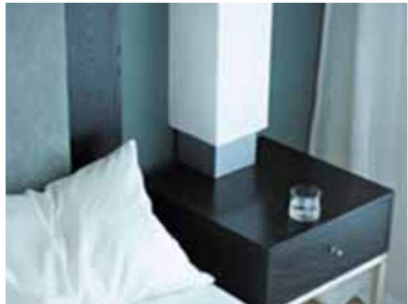
TABLE DE NUIT EN CORIAN® NOCTURNE.

Ici, une table de nuit profile ses contours nets et épurés; là, une étagère design épouse avec goût les contours d'un angle serré; là encore, la tablette du bureau accueille l'ordinateur portable comme le plateau du service d'étage.