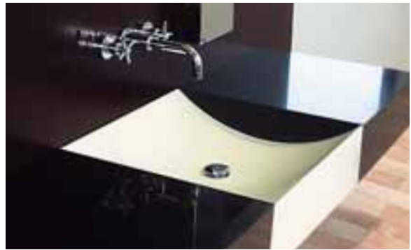
LAVABO "ZEN", MILAN, ITALIE. DESIGN MASSIMO FUCCI. VASQUE EN CORIAN® NOCTURNE ET CORIAN® BONE.

Se mariant idéalement avec le bois, l'inox ou le verre, Corian® crée des ensembles originaux. Que l'on opte pour le coup de fouet revitalisant d'une douche ou pour le délassement d'un bain, Corian® et les formes qu'il permet de façonner procurent une expérience inoubliable.