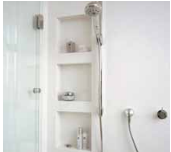
PAROIS DE DOUCHE INTÉGRALES AVEC ÉTAGÈRES INCORPORÉES. DESIGN CHARLES ZÄCH.