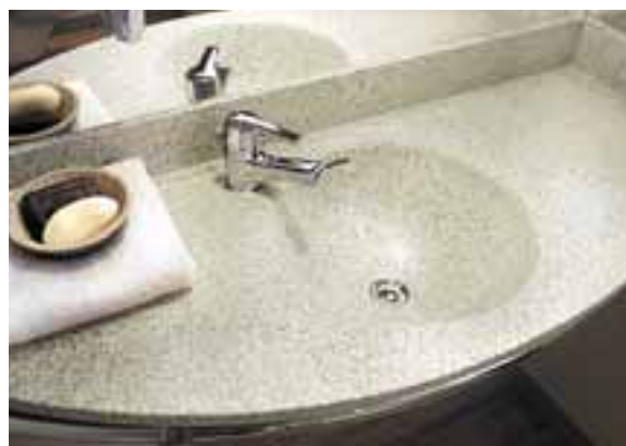
NOVOTEL, ROTTERDAM, PAYS-BAS. PLAN-VASQUE "TOUT EN UN" EN CORIAN® PYRENEES.

Sur le plan fonctionnel, Corian® garantit une hygiène irréprochable. Ses éléments massifs et non poreux s'assemblent sans joints perceptibles, créant ainsi des lavabos intégrés et des plans-vasques d'une pièce, simples et faciles à nettoyer et à entretenir.