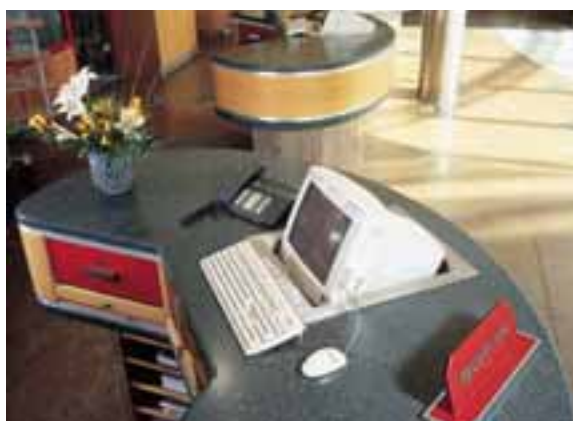
HÔTEL MÖVENPICK, OBERURSEL, ALLEMAGNE. TROIS COMPTOIRS DE RÉCEPTION EN CORIAN® RAIN FOREST ET EN BOIS.