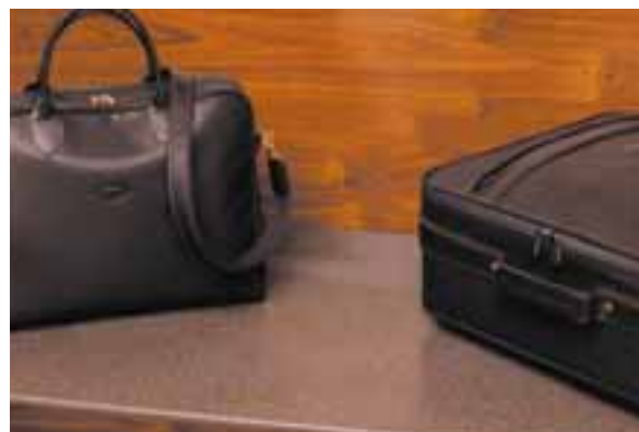
ÉTAGÈRE DE RANGEMENT POUR BAGAGES EN CORIAN® CANYON.